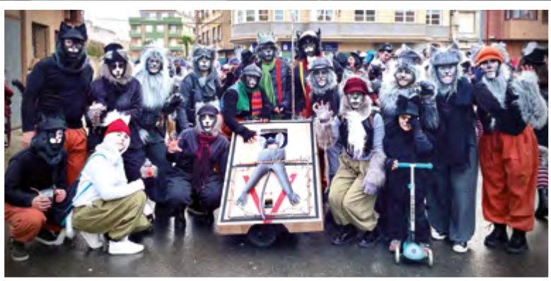
LOS DE SIEMPRE