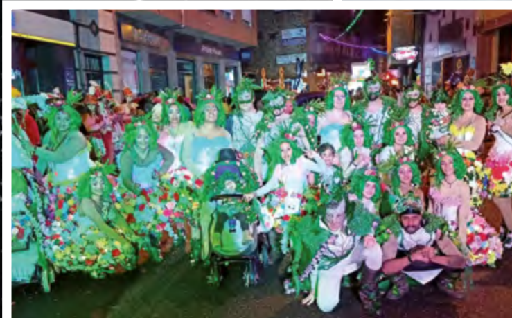
GRUPO LOS LATINOS