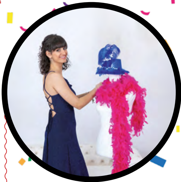
Marta ● Carro Amigo

Llega febrero y para muchos bañezanos y comarcanos, es una fiesta inexcusable en el calendario, pues llega nuestro querido Carnaval.