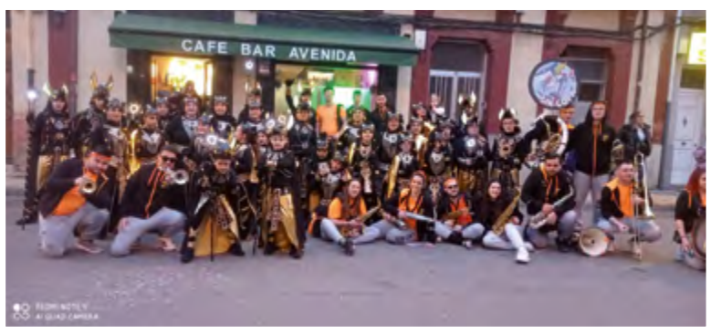
LA ALEGRIA DE LA HUERTA