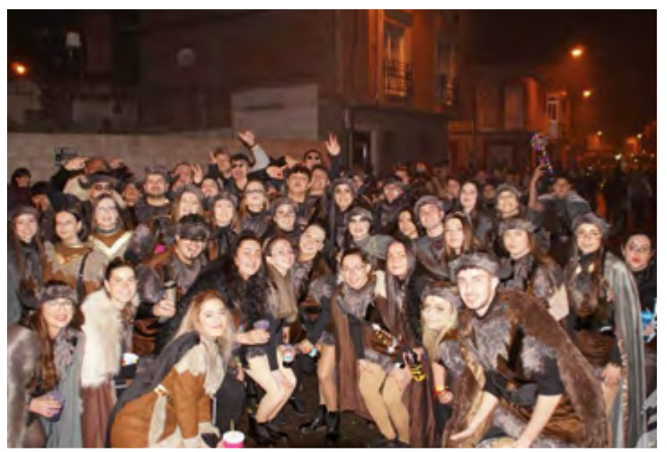
NI FU NI FA