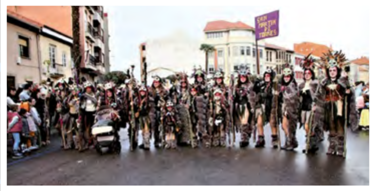
SAN MARTIN DE TORRES