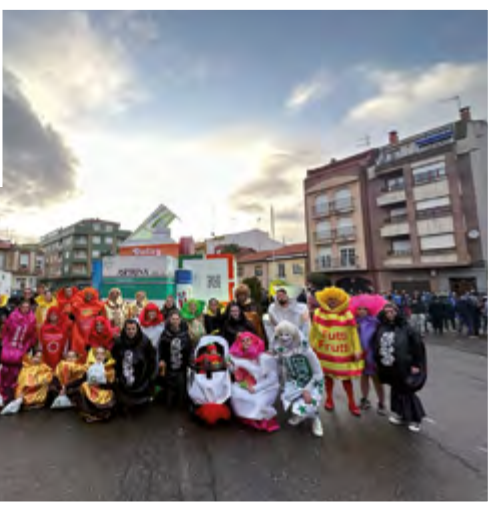
MUJERES, HOMBRES Y MI CERVEZA