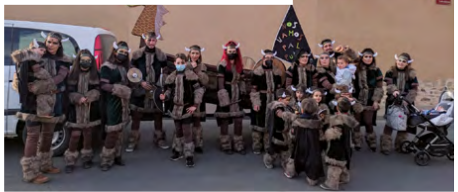
NOS VAMOS PAL PUEBLO