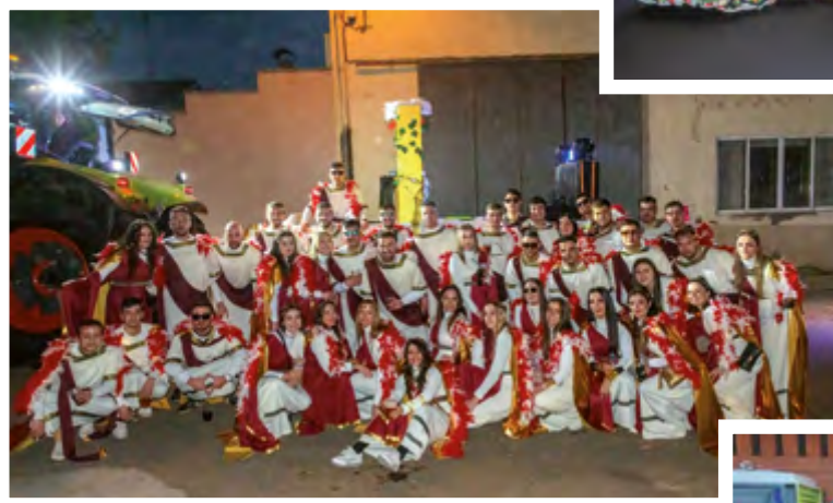
DE BAR EN PEOR