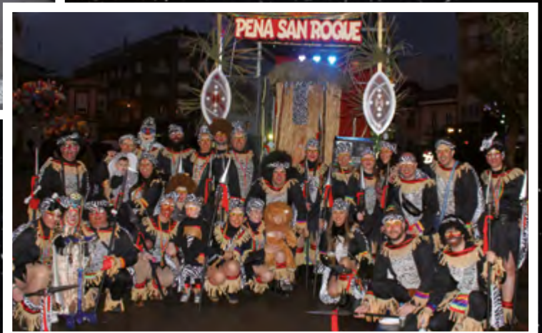
PEÑA SAN ROQUE