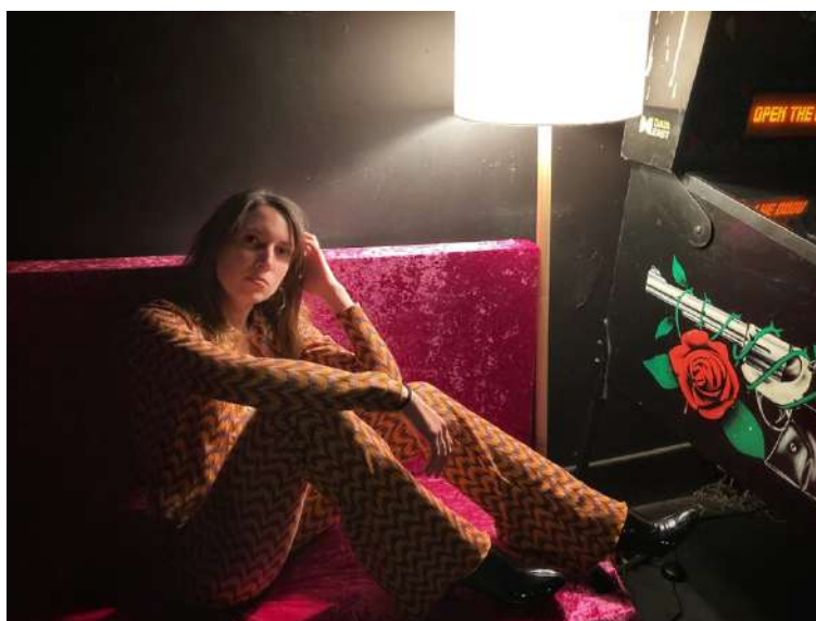
La fotógrafa Olivia LH

Hoy en día trabaja como fotógrafa social, equilibrando su tiempo entre eventos sociales y retratos promocionales. Su misión es simple: capturar la esencia y emoción de cada momento para artistas y profesionales, proporcionando imágenes auténticas y cercanas para sus sitios web y redes sociales.